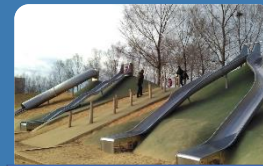
Turó Can Matès

Un cop per setmana es realitzarà una sortida de tot un dia